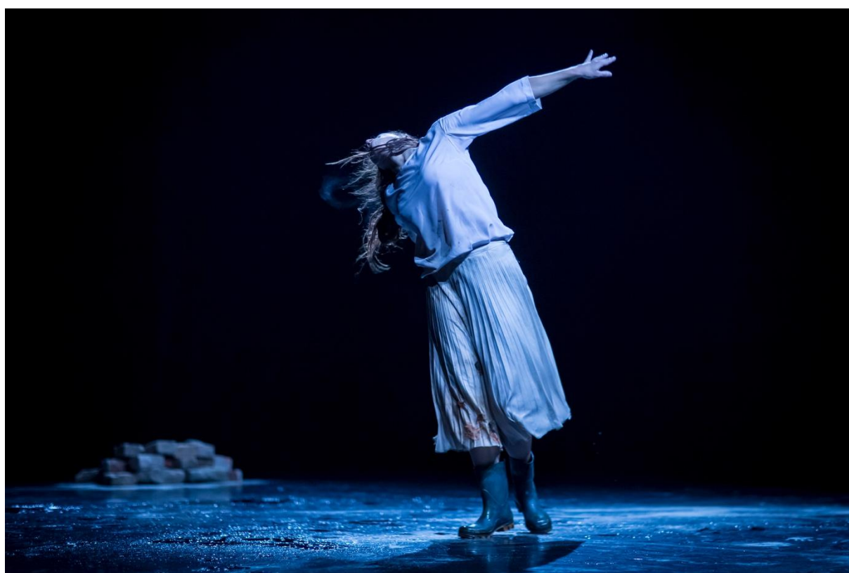
premiéra představení K Madoně se rzí

Představení K Madoně se rzí v roce 2021 shlédlo celkem 230 diváků.