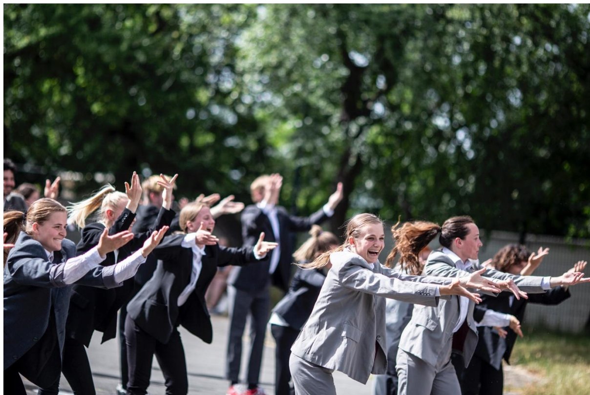
premiéra projektu Jáma Ivová UNLIMITED na Vítkově