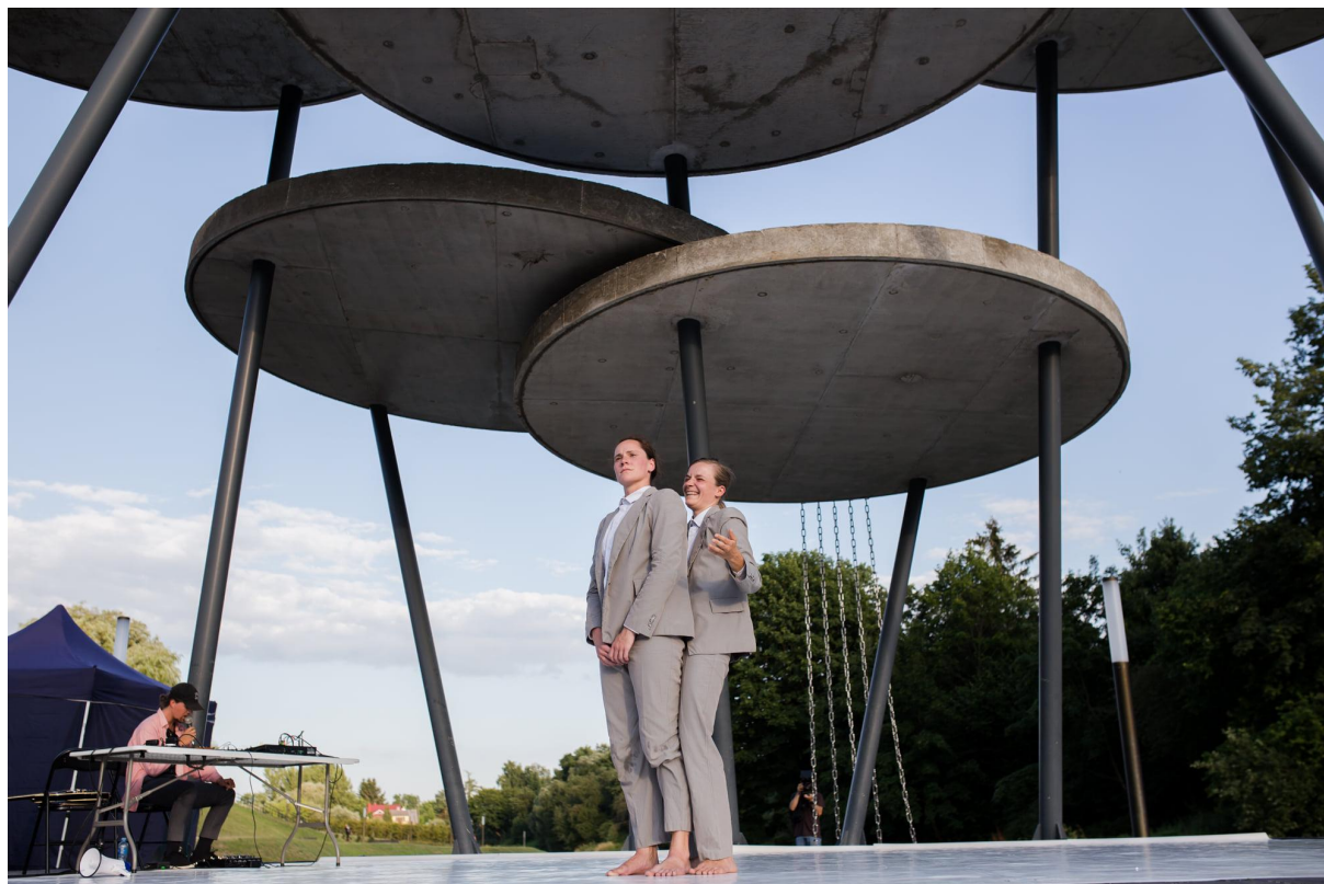
představení Jáma Ilová v Litvě