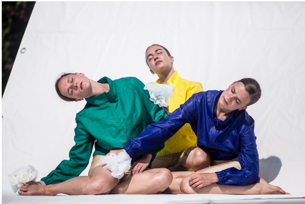
Treatment of Remembering v zahradách Trojského zámku

Podpořili: BAZAAR festival, REZI.DANCE Komařice, Moving Station Plzeň, Švestkový dvůr Malovice