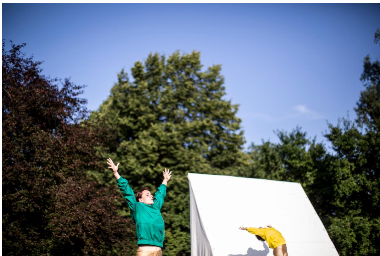
Treatment of Remembering na festivalu TANEC PRAHA

původního divadelního představení Treatment of Remembering pracuje s napětím mezi uměle vytvořeným sterilním prostorem a živoucím přírodním prostředím, které jej obklopuje.