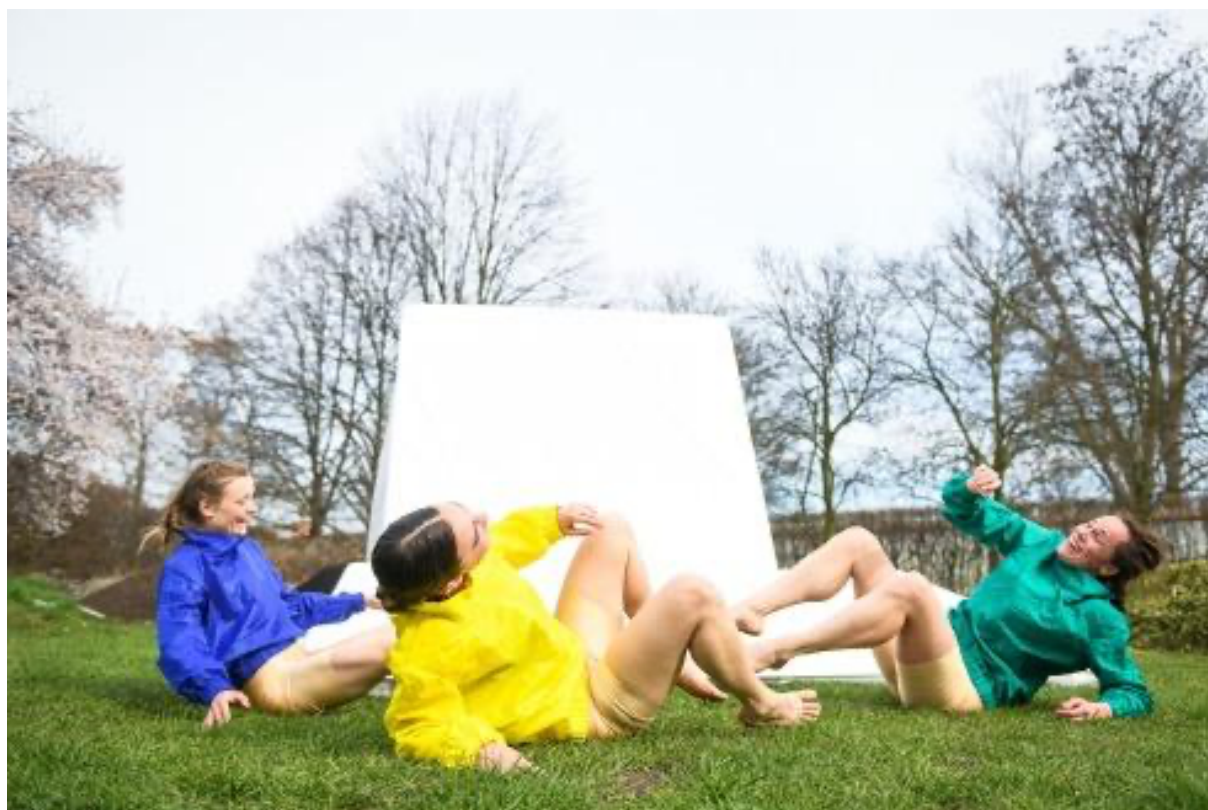
zkoušení venkovní verze Treatment of Remembering, foto: Michal Hančovský

Venkovní verzi představení Treatment of Remembering shlédlo celkem 290 diváků a desítky dalších náhodných kolemjdoucích.