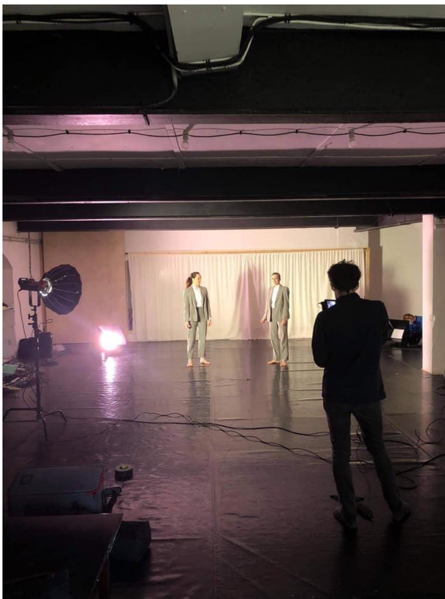
natáčení tutorial videí pro projekt Jáma Ilová UNLIMITED v TEP 39