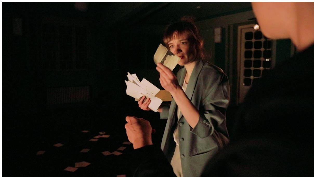
screenshot z filmu Folds of Touch

Taneční film Folds of Touch / Záhyby doteku vychází z představení Plné sklady citů, které je mezigeneračním experimentem zkoumajícím aspekty ženství inspirované autentickými životními vzpomínkami staré paní (babičky choreografky). Kamera zachycuje čtyři profesionální tanečnice, osmiletou dívku a devadesátiletou babičku na jevišti. Kamera snímá představení dokumentárně v reálném čase jeho průběhu, přesto nevzniká dokumentární, ale samostatný fiktivní film.