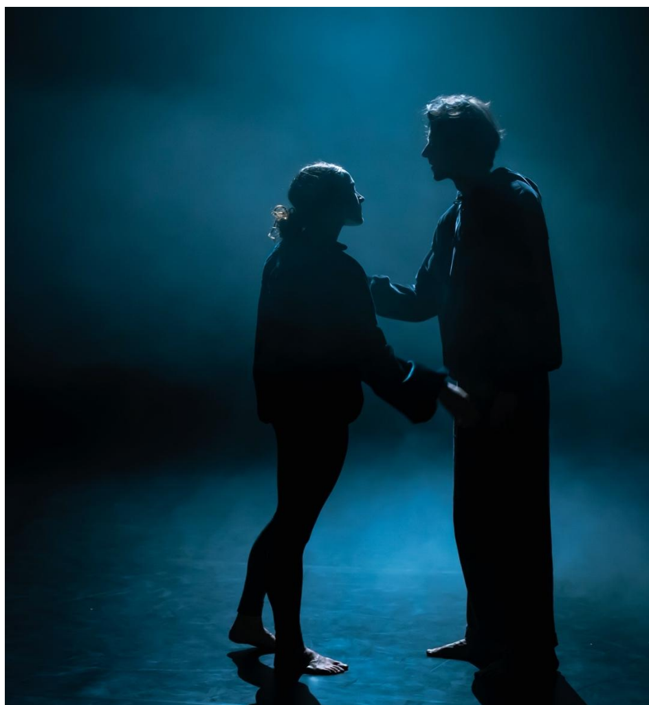
představení Na váhu!

Představení Na váhu! se z důvodu covidových opatření podařilo v roce 2021 odehrát pouze jednou a to 5. listopadu na jeho domovské scéně ve Venuši ve Švehlovce. Reprízy se zúčastnilo 40 diváků .