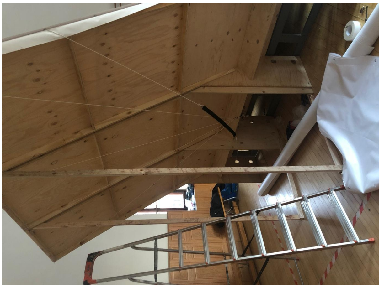
technické práce na představení Treatment of Remembering, Měšice

Po premiéře představení Treatment of Remembering na podzim roku 2020 nebylo možné kvůli pandemickým opatřením představení dále reprízovat. V lednu 2021 před první reprízou představení se tvůrci rozhodli na představení dále zapracovat a doladit jeho podobu jak po technické stránce – úprava scénografie tak po stránce dramaturgické – změny ve scénosledu, hledání nového pohybového materiálu, dotažení dynamiky a choreografické přesnosti jednotlivých scén i díla jako celku. První rezidence proběhla na sále zámeckého areálu v Měšicích od 28. do 31. ledna.