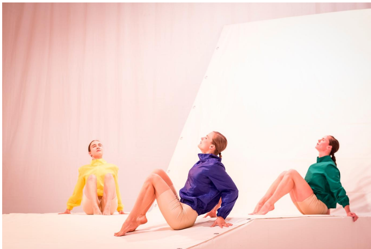
Treatment of Remembering na České taneční platformě

Podpořili: BAZAAR festival, REZI.DANCE Komařice, Moving Station Plzeň, Švestkový dvůr Malovice