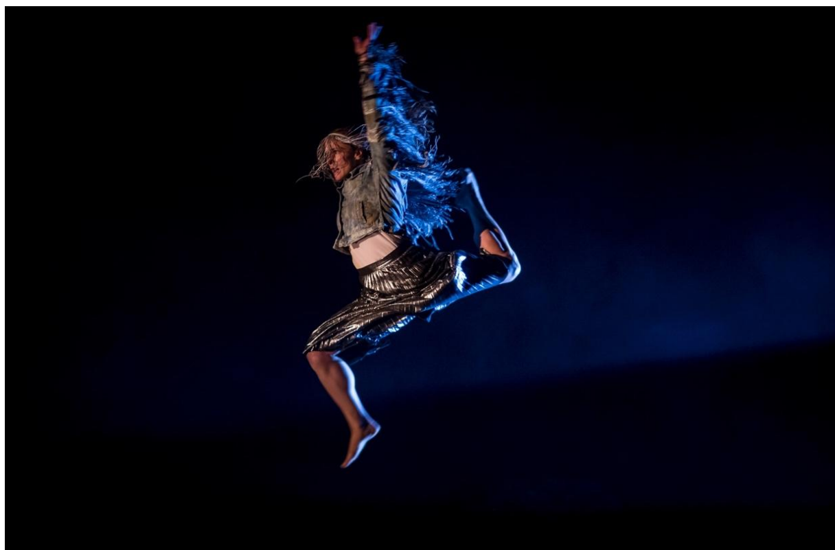
premiéra představení K Madoně se rzí